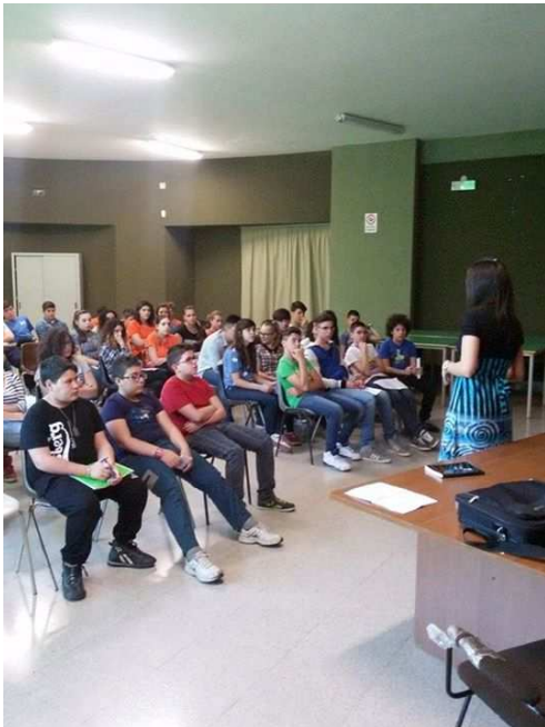
Istituto Comprensivo "A.Moscati" – 13/05/2015

I laboratori di scrittura creativa nascono proprio dall'applicazione delle potenzialità creative dei bambini e hanno consentito loro di elaborare nuove ed originali soluzioni utili alla creazione di piccole storie di fantasia frutto della loro immaginazione. Ogni classe che ha partecipato al "Maggio dei Libri" ha infatti, durante gli incontri, elaborato diversi piccoli racconti partendo dalle conoscenze acquisite dalle due autrici attraverso esperienze dirette o indirette (ad esempio di lettura e/o visive).