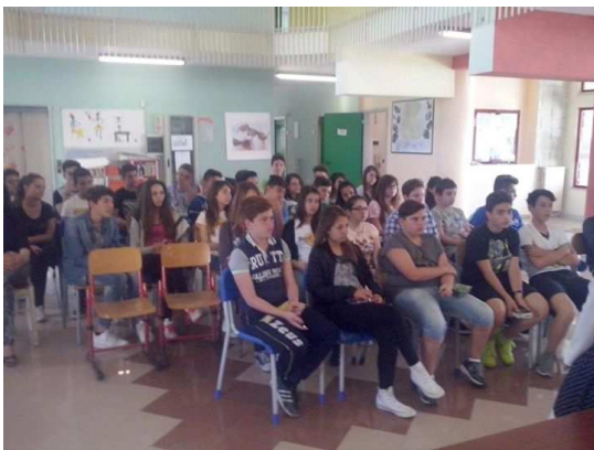
Istituto Comprensivo "S.Antonio" – 20/05/2015