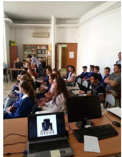
1° Circolo didattico "Dante Alighieri" – Presso la Biblioteca Comunale – 19/05/2015

L'iniziativa quindi non ha avuto il suo punto focale nella presentazione delle due opere ma ha ruotato attorno all'importanza delle descrizioni. Descrivendo in maniera interattiva e divisi in piccoli team un'immagine si è dato valore al lavoro di gruppo con i compagni di classe, all'importanza delle parole che vengono utilizzate meno durante il corso di una giornata e soprattutto alle immense potenzialità nascoste all'interno di un libro che amplia gli orizzonti del proprio bagaglio culturale e linguistico.