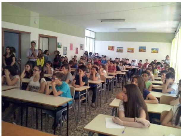
Scuola Media "Picentia" – 12/05/2015